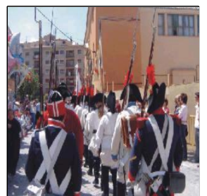
Batallones por las calles del castillo de Almansa (Representación)

R: Me gustaría que hace diez años hubiéramos hecho ya un ensayo sobre esta celebración para que en la conmemoración que haremos durante este año 2007 ya hubiéramos adquirido experiencia en este tipo de actos.