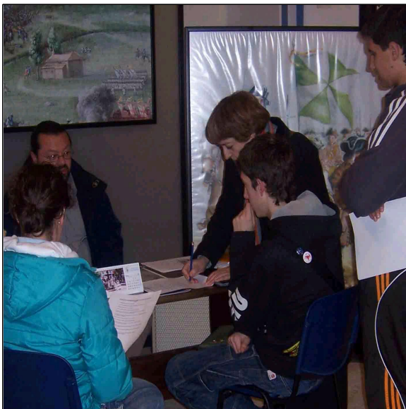
Entrevista a Herminio Gómez en la Ermita de San Blas

"El motivo de esta batalla fue la disputa del trono español tras la muerte sin descendencia directa de Carlos II."